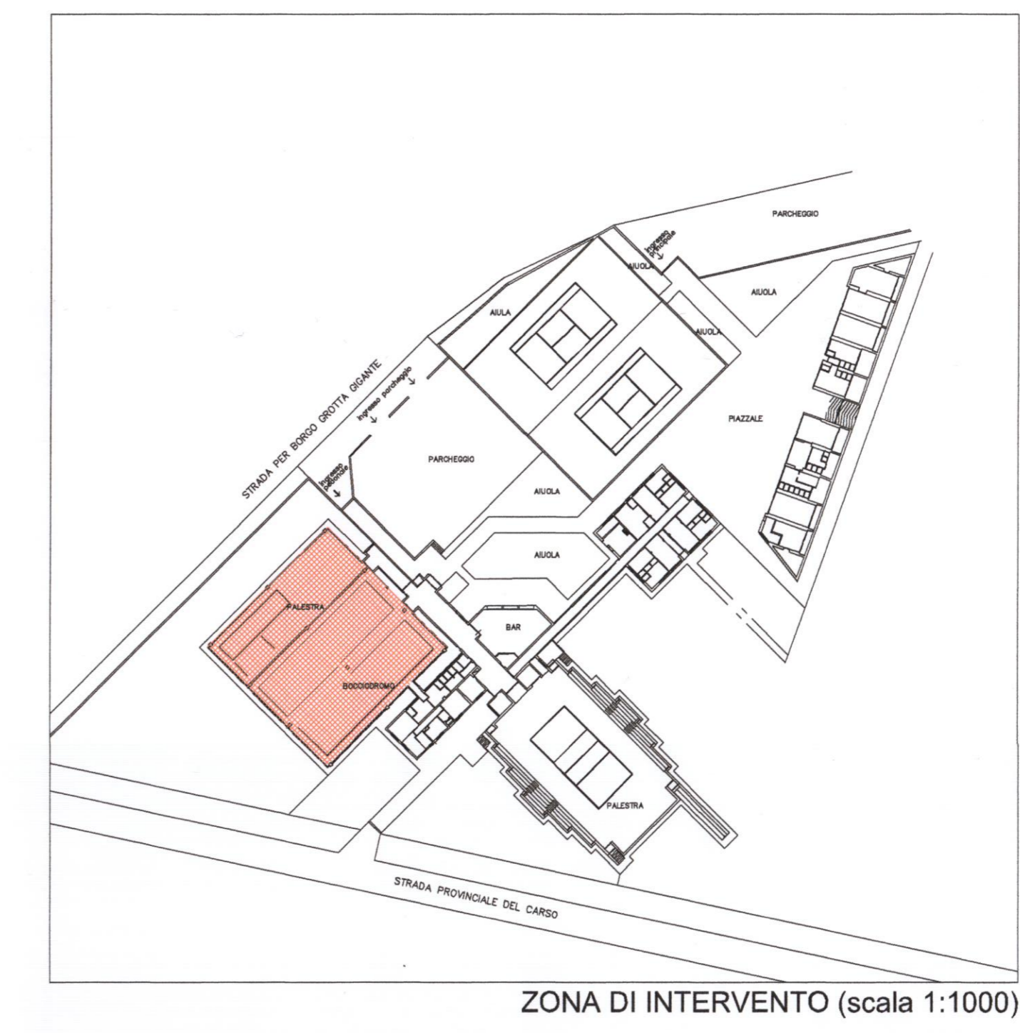
ZONA DI INTERVENTO (scala 1:1000)