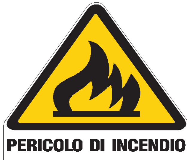
Nome: pericolo incendio Posizione: deposito