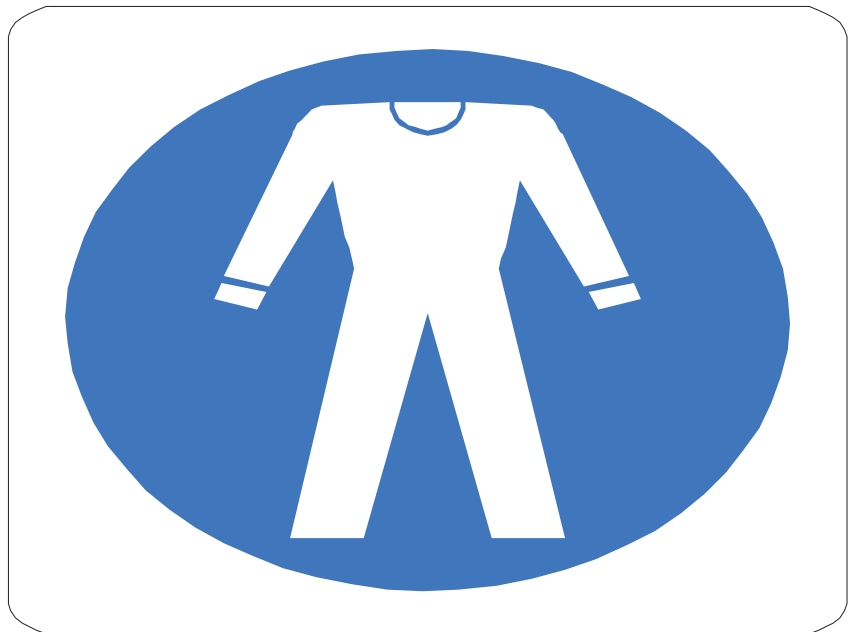
Nome: indumenti protettivi Posizione: All'ingresso del cantiere.