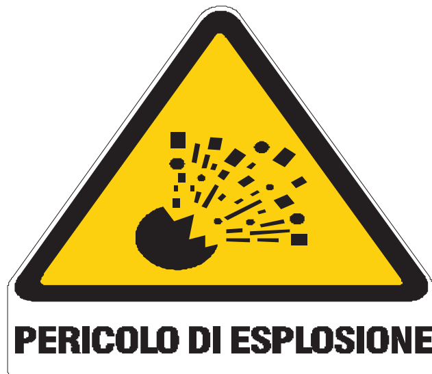
Nome: pericolo esplosione Posizione: deposito