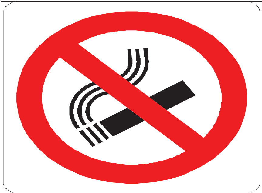
Nome: vietato fumare Posizione: deposito - lavorazione